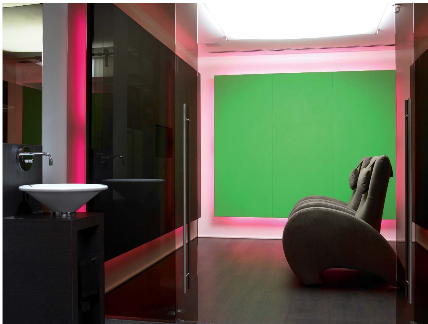
Ryc. 1_Poczekalnia w studio GlamSmile.

Podczas pierwszej wizyty wykonuje się zdjęcia i pobiera wyciski. Następna faza polega na sporządzeniu za pomocą programu komputerowego projektu licówek. W procesie projektowania i wykonywania bardzo cienkich licówek wykorzystuje się technologię CAD/CAM. Natomiast wyjątkowy system ich pozycjonowania umożliwia lekarzowi precyzyjne i jednoczesne założenie licówek na łuk zębowy w czasie krótszym niż godzina. Licówki są wykonywane w laboratorium Soca w Bordeaux z materiałów kompozytowych lub z porcelany i przesyłane do gabinetu. Podczas drugiej wizyty