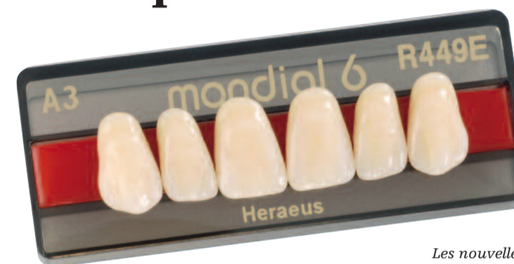
Les nouvelles dents antérieures Mondial 6E présentent un contraste dentine-incisal important qui procure un aspect vivant et esthétique.