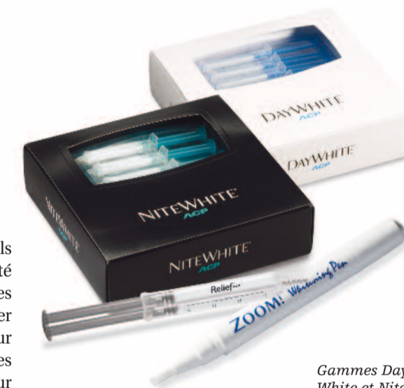
Gammes Day White et Nite White

Les produits de blanchiment Discus Dental sont les seuls à intégrer dans leur formulation de l'ACP, un actif breveté qui permet de diminuer significativement les éventuelles sensibilités liées ou non au traitement et de reminéraliser la surface de l'émail, en apportant lustre et brillance pour un résultat plus harmonieux. De nombreuses références sont disponibles afin de proposer un traitement sur mesure aux patients qui souhaitent éclaircir leur sourire.