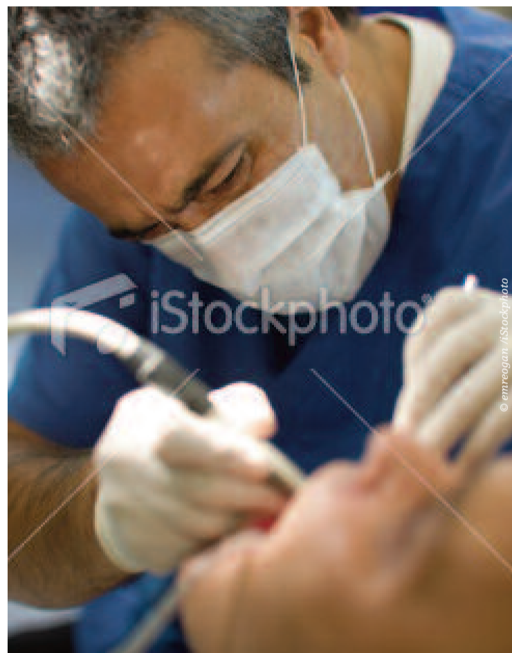
60 % de toute la dentisterie opératoire est consacré aux restaurations en résine dentomimétique.

L'idée du Dr Tay découle de son examen du chemin que parcourent des cristaux dans la nature, tels que dans les coquilles d'œuf et de l'ormeau. Ces cristaux, appelés hydroxylapatite, adhèrent quand les protéines et les minéraux interagissent. Le Dr Tay utilisera du phosphate de calcium, qui est le composant fondamental de la dentine, de l'émail et le l'os, et deux protéines similaires, également trouvées dans la dentine, pour imiter la nature, en commandant la taille de chaque cristal. En théorie, les cristaux devraient fixer les minéraux dans la couche hybride et l'empêcher de dégrader. « Au contraire des dentistes qui restaurent des dents avec des adhésifs décevants, nous espérons que l'utilisation de ces cristaux pendant le processus d'adhésion fournira la force pour sauver les liaisons. Notre but final est que ce matériau répare une cavité, de manière autonome, de sorte que les chirurgiens-dentistes ne doivent pas obturer la